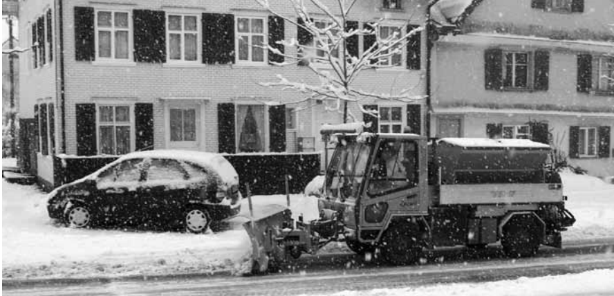
Bei schlechter Witterung, Schneefall und Glätte sind die Mitarbeiter des Unterhaltsdienstes besonders gefordert.

Bereits seit einigen Wochen sind die Berge weiss eingefärbt. Die Schneeflocken lassen in Zuzwil noch auf sich warten, doch nach typisch herbstlichen Monaten darf es nun bald Winter werden. Zum Glück sind die Mitarbeiter des Unterhaltsdienstes bereits seit einiger Zeit für die kälteste Jahreszeit gerüstet. So kann die Sicherheit auf den Strassen auch während den Wintermonaten gewährleistet werden.