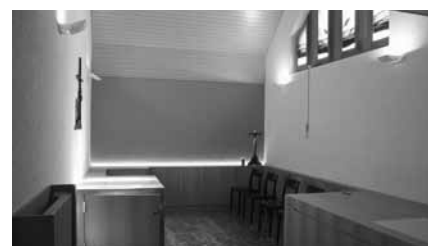
Im frisch renovierten Aufbahrungsraum sind zwei neue Katakalken eingebaut.

Im November 2019 konnte die Renovation des Aufbahrungsraums mit dem Einbau von zwei neuen Katakalken abgeschlossen werden. Der Aufbahrungsraum bietet seither eine würdevolle Atmosphäre und ist stilvoll eingerichtet. Der Gemeinderat hat die Bauabrechnung mit Kosten von rund 64'500 Franken genehmigt.