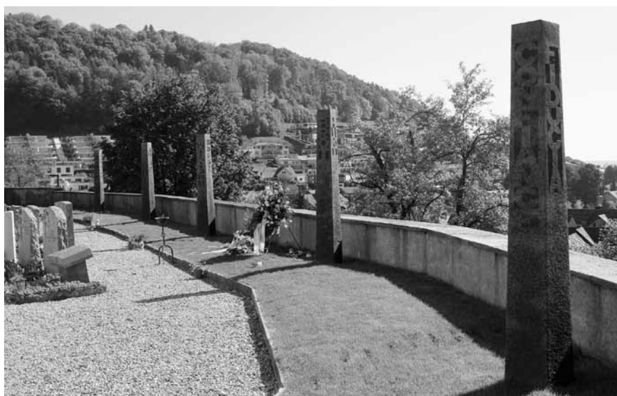
Auf dem Friedhof Zuzwil stehen fünf Gemeinschaftsurnengräber zur Verfügung. Im Herbst 2020 werden die zwei letzten Gemeinschaftsurnengräber erstellt.

Seit Jahren wird bei Todesfällen vermehrt die Kremation anstelle einer Erdbestattung gewünscht. Die Nachfrage nach Gemeinschaftsurnengräbern ist deshalb stark angestiegen. Im Herbst sollen nun die beiden letzten Gemeinschaftsurnengräber mit Stelen auf dem Friedhof in Zuzwil errichtet werden.