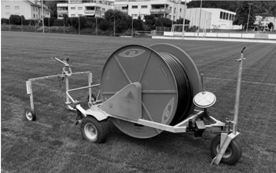
Der während der Spielsaison stark beanspruchte Rasen des Fussballplatzes wird in der Nacht mit Augenmass gewässert, damit langfristige Schäden vermieden werden.

Die anhaltende Trockenheit verlangt einen bewussten und verantwortungsvollen Umgang mit Wasser. Die Wasserreserven stehen zunehmend unter Druck. Deshalb ist die Bevölkerung aufgerufen, den Wasserverbrauch überall dort zu reduzieren, wo dies ohne grössere Einschränkungen möglich ist. Jeder eingesparte Liter Wasser trägt dazu bei, die Versorgung zu schonen und die natürlichen Ressourcen zu erhalten.