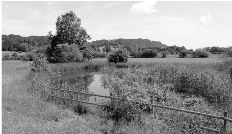
Bitte führen Sie die Hunde während der Setz- und Brutzeit im Riet durch die Wiesen und im Wald an der kurzen Leine und bleiben Sie auf den Wegen.

Der Frühling ist eine besonders empfindliche Phase für Pflanzen, Wildtiere und die Landwirtschaft. Wiesen wachsen, Kulturen entwickeln sich und viele Tiere bringen ihre Jungen zur Welt. Gleichzeitig nutzen zahlreiche Menschen die Natur zur Erholung. Damit dieses Nebeneinander funktioniert, ist ein respektvoller Umgang mit der Umgebung entscheidend.