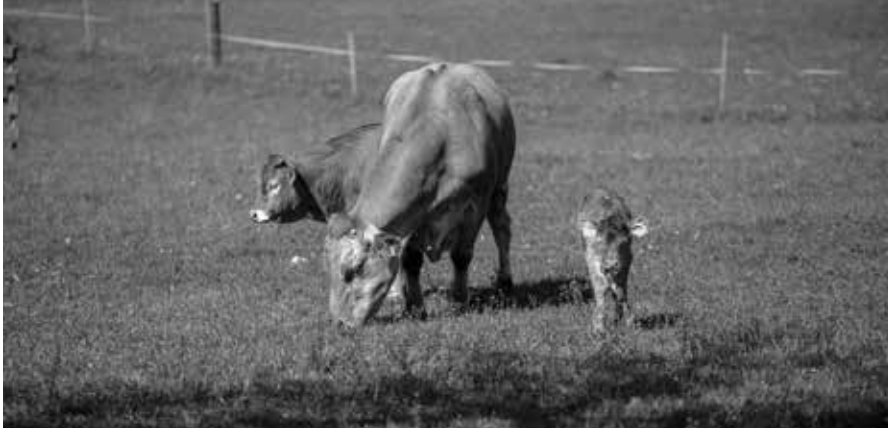
Schon bald werden die Kühe, Rinder und Kälber auf den Wiesen weiden.

Die Sömmerungsvorschriften für den Auftrieb von Vieh auf Alpen und gemeinsame Weiden sind inhaltlich weitgehend identisch mit denjenigen vom Vorjahr.