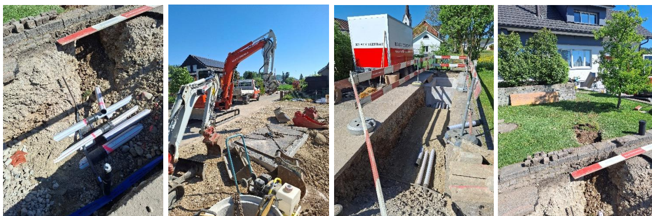
Abbildung 2: Baustelle Neufeldstrasse in Züberwangen vom 02.05.2025

Die Gemeinde (EW) erneuerte die veralteten Stromleitungen an der Neufeldstrasse (Süd). Die Wasserkorporation hat sich entschieden, die Hauptwasserleitung aus dem Jahr 1968 in die Strasse zu verschieben und zu erneuern. Die neue Leitung ist so konzipiert, dass ein allfälliges MFH Neufeld angeschlossen werden kann. Im Rahmen solcher Strassenaufbrüche lassen sich jeweils Synergien nutzen und es macht Sinn, die Werkleitungen zu erneuern und auf den neusten Stand der Technik zu bringen.