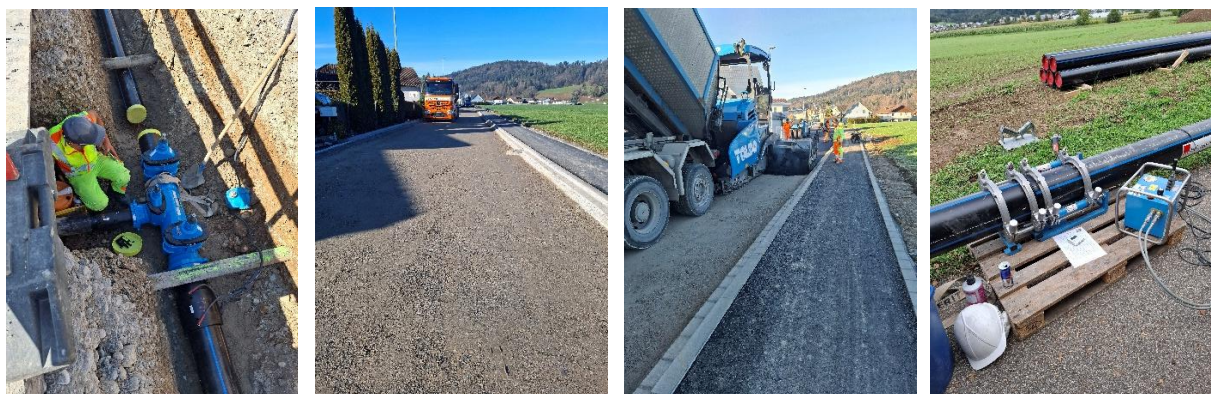
Abbildung 1: Baustelle Weierenstrasse in Züberwangen vom 02.09.2025

Die erste Bauetappe mit der Erneuerung der Werkleitungen Wasser und Strom beim Knoten Feldhof-/Weierenstrasse in Richtung Züberwangen konnte per ende Dezember 2025 abgeschlossen werden.