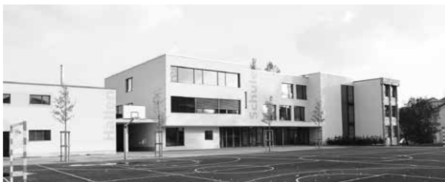
Das Absenzenreglement und das Betriebsreglement Tagesstrukturen Zuzwil unterstehen bis 17. Dezember 2025 dem fakultativen Referendum.

Der Gemeinderat passte infolge der neuen Schulorganisation das Absenzenreglement und das Betriebsreglement Tagesstrukturen Zuzwil an. Damit sollen die Zuständigkeiten wieder der heute gültigen Gemeindeordnung entsprechen.