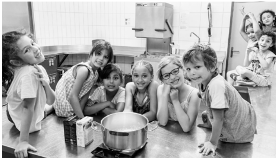
Strahlende Kinderaugen während der Ferienbetreuung in der TAGIZ.

Mit grosser Freude kann die Eröffnung der TAGIZ in Züberwangen verkündet werden. Dank der zahlreichen Anmeldungen wird die TAGIZ am Standort Züberwangen ab dem 12. August 2024 zunächst mit dem Mittagsmodul starten. Dieses wird montags, dienstags und donnerstags angeboten. Je nach Entwicklung der Nachfrage werden weitere Module zu einem späteren Zeitpunkt folgen.