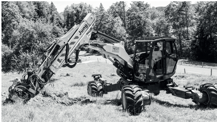
Baugrundsondierungen im Gebiet Chellhof.

Beim Hochwasserschutzprojekt Dorfbach wird im Hintergrund fleissig gearbeitet. Die Baugrundsondierungen im Bereich des vorgesehenen Rückhaltebeckens bestätigten, dass der Untergrund teilweise belastet ist. Allfällige Sanierungsmassnahmen werden ausserhalb des Bachprojekts umgesetzt.