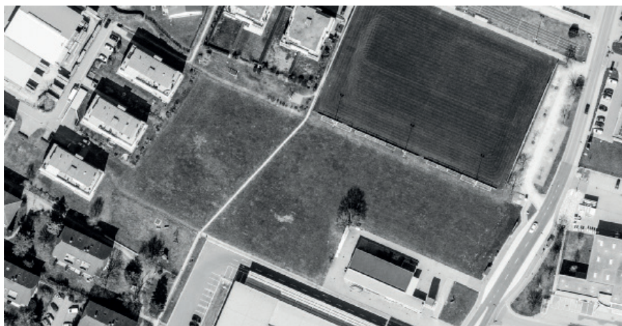
Zwischen den Mehrfamilienhäusern «Im Baumgarten» und der Herbergstrasse soll ein provisorisches Rasen-Trainingspielfeld erstellt werden.

Die Kapazität der beiden Rasenspielfelder in Zuzwil und Zübingen genügen den über 400 Mitgliedern des einheimischen Fussballclubs längst nicht mehr. Die Stimmbürgerinnen und Stimmbürger können an der Bürgerversammlung von Ende März 2023 über einen Kredit von 625'000 Franken für die Realisierung eines provisorischen Rasen-Trainingspielfeldes an der Herbergstrasse abstimmen.