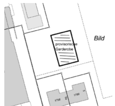
Parkplatz westlich des Sportplatzes.

Gemäss Offerte belaufen sich die Kosten für die Container-Garderobe auf insgesamt 475'700 Franken. Der Betrag wird in die Investitionsrechnung 2023 eingestellt. Damit die Projektierung und Realisierung effizient umgesetzt werden können, setzt der Gemeinderat eine Baukommission ein. Diese besteht aus Vertretern der Gemeinde, der Betriebskommission Liegenschaften sowie dem Fussballclub.