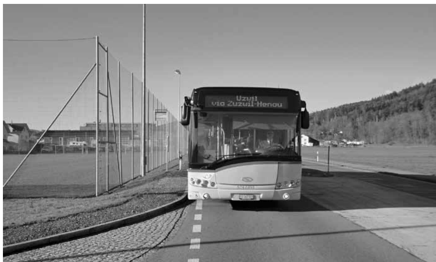
Die Postautohaltestelle an der St.Gallerstrasse wird seit vier Jahren gut genutzt.

Aufgrund der guten Frequenzen soll die provisorisch eingerichtete Postautohaltestelle an der St.Gallerstrasse in Züberwangen definitiv umgesetzt werden. Der Gemeinderat hat sich positiv zum Bauprojekt geäussert und dem Kanton St.Gallen einen Gemeindeanteil von 91'400 Franken zugesichert.